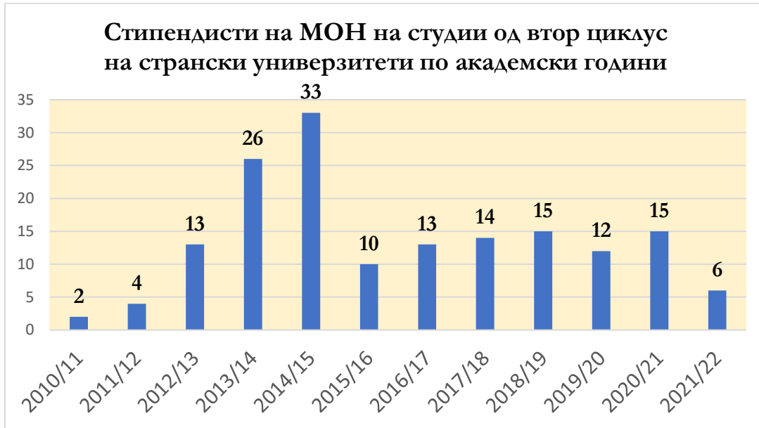
Слика 2. Бројот на стипендисти од МОН во текот на неколку академски години за студии на втор циклус на странски универзитети.